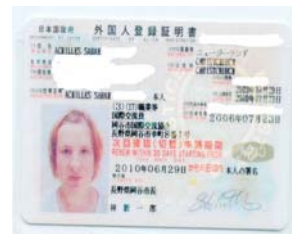
KARTU TANDA PENDUDUK ORANG ASING

JIKA INGIN MENGGANTI ALAMAT DAN PINDAH KERJA HARUS MELAPORKAN DIRI KE KANTOR PEMERINTAH DAERAH (BAILAI KOTA) SAMPIL MEMBAWA KARTU TANDA PENDUDUK MAKA PEGAWAI BALAI KOTA AKAN MENULIS ALAMAT KITA YANG BARU DI ALAMATNYA KARTU TANDA PENDUDUK TERSEBUT. APABILA ORANG ASING TERSEBUT INGIN PINDA DARI OKAYA KE TEMPAT YANG LAIN HARUS MELAPORKAN DIRI KE TEMPAT YANG BARU DAN MEMBAWA KARTU TANDA PENDUDUK YANG BARU DAN MEMBAWA KARTU TANDA PENDUDUK YANG LAMA. JIKA ARANG TERSEBUT BERHALANGAN UNTUK MELAPORKAN DIRI KE TEMPAT YANG BARU DAN MEMBAWA KARTU TANDA PENDUDUK YANG LAMA. JIKA ORANG TERSEBUT BERHALANGAN UNTUK MELAPORKAN DIRI KE TEMPAT YANG BARU DAPAT DIWAKILKAN. TETAPI JIKA INGIN MENGGANTI KARTU TANDA PENDUDUK YANG BARU TIDAK DAPAT DIWAKILKAN SATU HAL LAGI YANG PALING PENTING TINGGAL DI JEPANG ADALAH SURAT KETERANGAN PENDUDUK INI PENTING UNTUK MASUK SEKOLAH, MASUK KERJA, DAN MEMBUAT SIM JEPANG, SURAT KETERANGAN PENDUDUK ORANG ASING DAPAT DIMINTA DI BAGI AN ORANG ASING. JIKA INGIN MENGAMBIL SURAT KETERANGAN PENDUDUK ORANG TERSEBUT BERHALANGAN. PADA WAKTU ITU HARUS ADA SURAT KUASA UNTUK MEWAKILKAN MENGAMBIL SURAT KETERANGAN PENDUDUK TERSEBUT. BIAYA UNTUK SATU LEMBAR SURAT KETERANGAN PENDUDUK SEKARANG 300 DAN ORANG YANG MEWAKILKAN HARUS MENJELASKAN UNTUK APA SURAT ITU DIAMBIL.