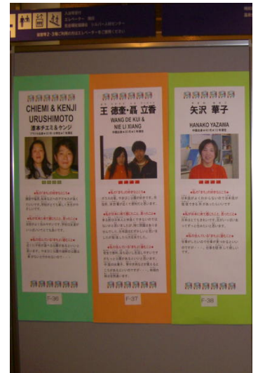
'Global Citizens Message Exhibition' Panels

Alem de entrevistar os moradores estrangeiros, entrevistamos também 20 cidadãos japoneses com ligações com estrangeiros em diferentes níveis; expectativas para futuras interações, e também lugares para serem visitados. Pelas entrevistas conseguimos obter opiniões valiosas que esperamos poder usar para tornar Okaya um lugar melhor para se viver no futuro.